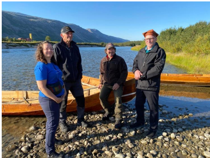
Porsáŋgu Musea – johkafanasdeavvadeapmi 2023 (Lakselva)

Mii leat 2023:s lasihan 18 ođđa dávvira primusii, ja 37 dávvirii leat mii lasihan ođđa govaid, mihtuid dahje čilgehusaid. 55 dávvira ges leat lokaliseren ja kvalitehtasihkarastan registrerejuvvon dieđuid.