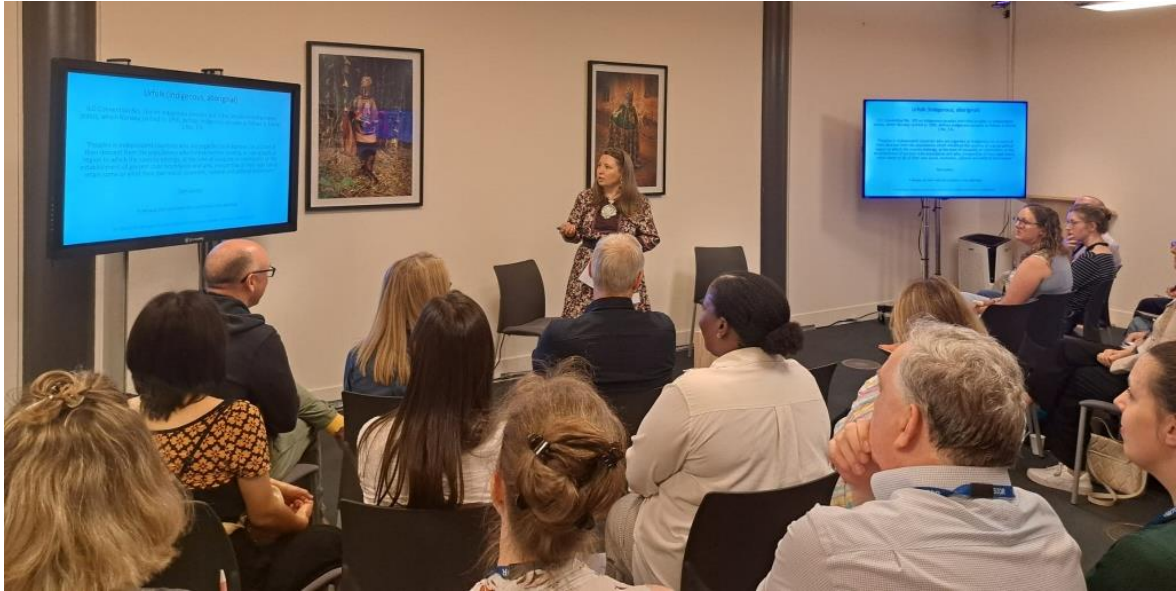
Direktevra Anne May Olli logaldallá Pitt Rivers Museum, Oxford, England.