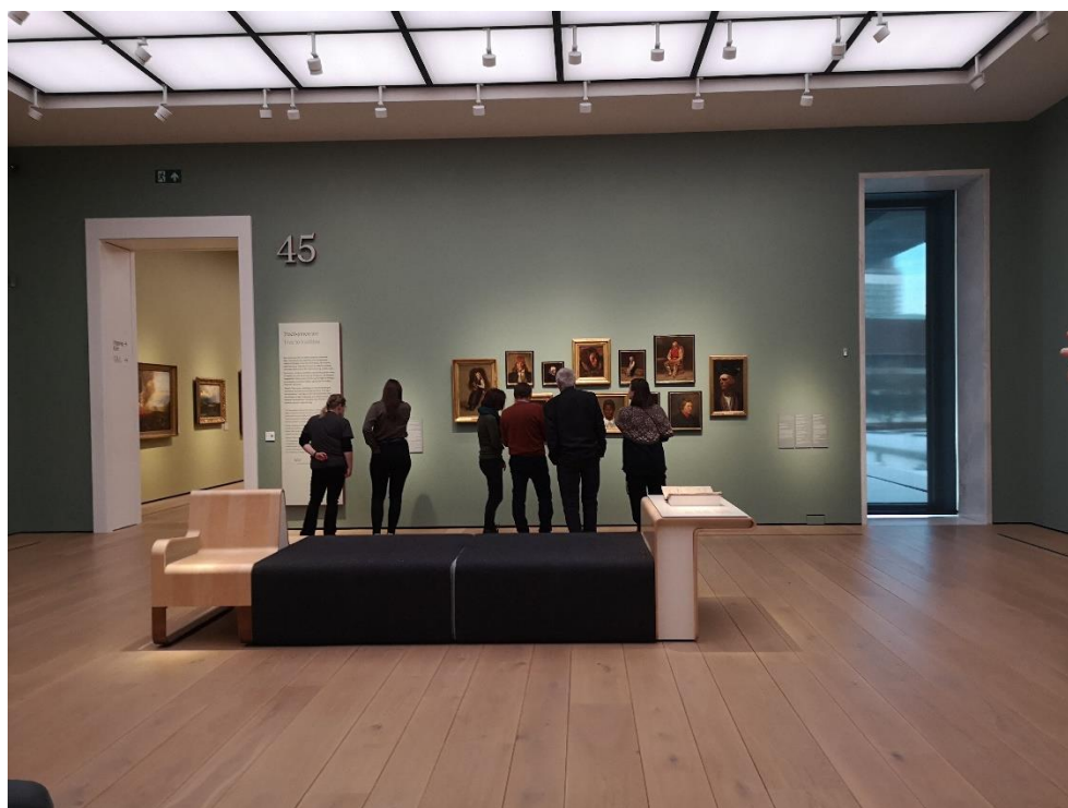
Styre og ansatte besøkte Nasjonalmuseet i Oslo 7.12.23