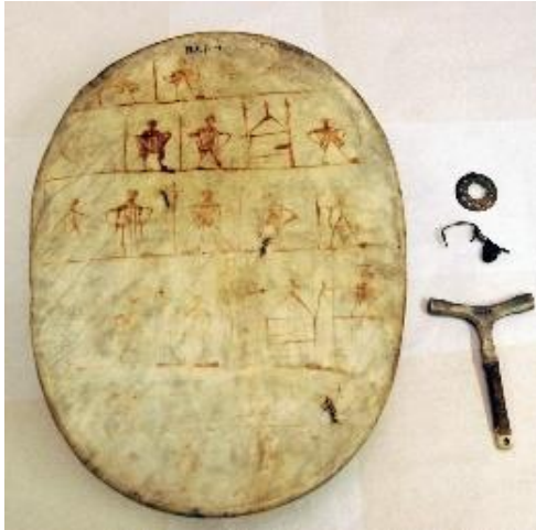
Gova 1: The drum of Paul-Ánde, Anders Poulsen.