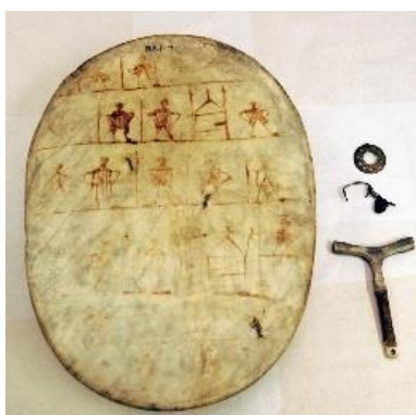
Govva 1: The drum of Paul-Ánde, Anders Poulsen.