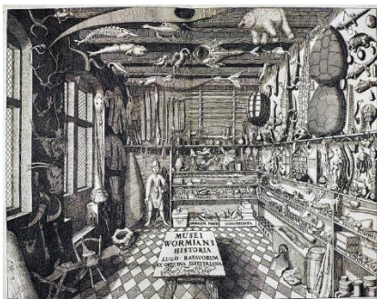
Picture 4: Picture: The frontispiece from the Museum Wormianum depicting Ole Worm's (Olaus Wormius (1588–1654)) cabinet of curiosities, which Frederick III of Denmark added to his collections in his Kongens Kunstkammer.