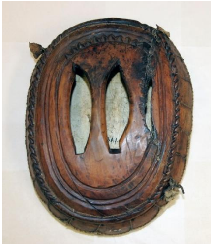
Gova 2. The back side of the drum.