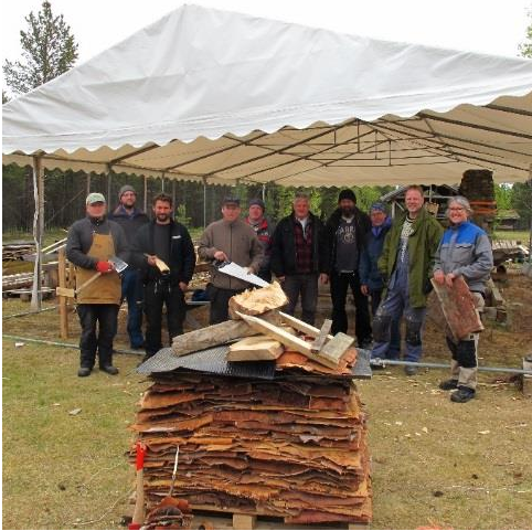
Návetdivodeapmi 08.06. R. Renmælmo ja S. Holmin ovttas NTNU studeanttaiguin.

Olgomusea Njállá lea divoduvvon ja ođđa stoalpu lea gárvvís. Gođiin leat molson darffi man lei dárbu molsut.