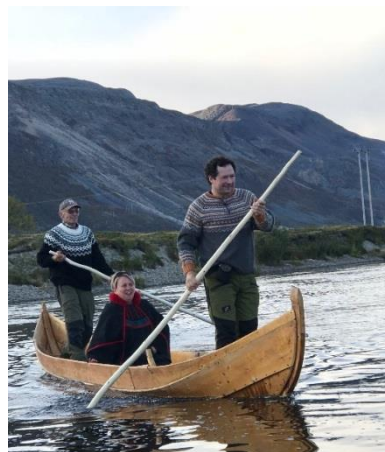
Govva@RDM Lindback vieljažagat ja sátnjeođiheadji Borch