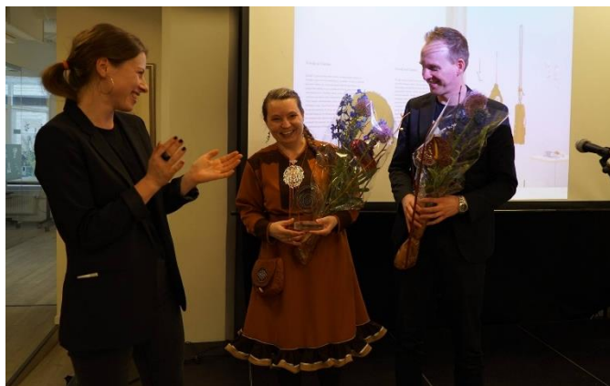
Govva@NNKM FB-siidu: Kunstkritikerprisen geigejuvui Oslo Sámi viesus.

Miessemánu 4. beaivvi ožžo RiddoDuottarMuseat ja Davvi-Norgga dáiddamusea 2017 Kunstkritikerprisen -bálkkašumi musea “performanca” Sámi Dáiddamusea ovddas. Bálkkašupmi geigejuvvui Oslo Sámi viesus.