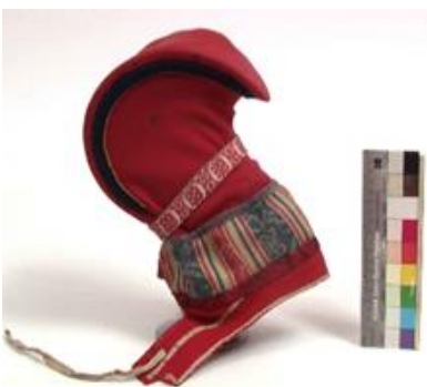
1@Bååstede: Ládjogahpir mii fievrriduvvo Norgga álbmotmuseas ruovttoluotta.

Dávviid álgobohtu lea Guovdageainnus, Kárášjogas, Fálesnuoris ja Porsáנגgus. Dasa lassin juogadedje sámi dávviriid main ii leat gullevašvuohta Finnmárukui muhto mat bohtet muđui Norggas. RDM:i leat fievrriduvvon 734 dávvira. Fysalaš sirdin dáhpáhuvvá go museaid magariinnaid leat ođasmahtán.