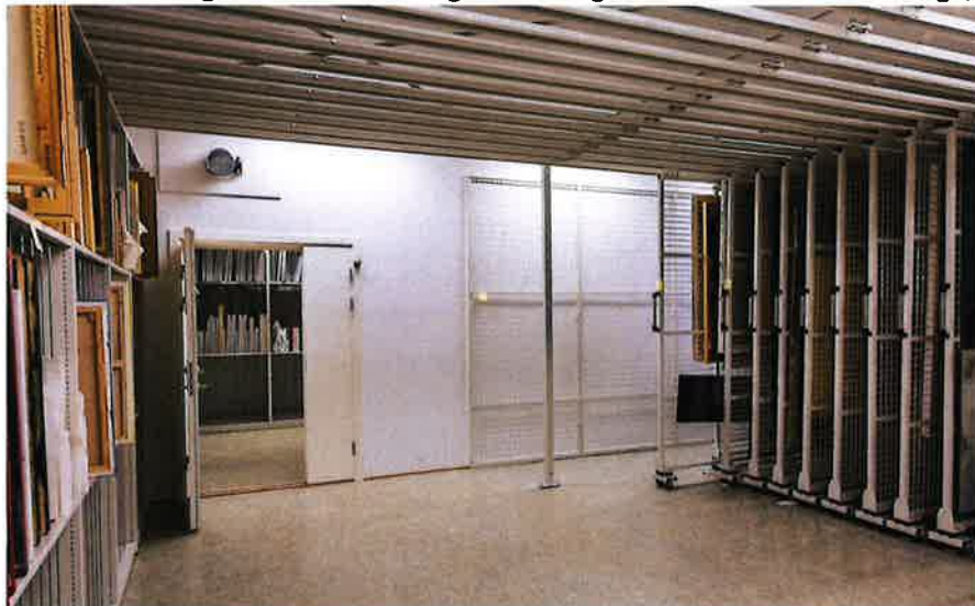
Odđá dáiddamagasiidna mii lea Sáp̄miko:s

2016 čavčča bidje dáiddamagasiidnii hilduid ja lođáid mat leat vuogádagat mat heivejit dáidaga vurrkodeapmái. Eanas oassi Sámedikki dáidda, ja deponiija dáidagat sirdojuvvoje ja biddjoje magasiinnaide. SDM lea searvan oktasaš Primusčoahkkimii Guovdageainnus. SDM registrerii 2016:s sullii 500 dáidaga. Sámi dáiddamagasiidna registrerii 2016:s 1202 dáidaga, ja publiserii 98.