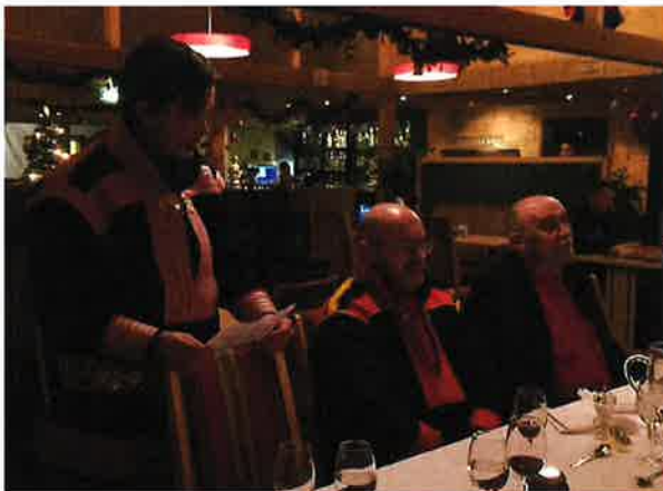
STIVVRAJODIHEADDJI KALSTAD DOALLÁ SÁRTNI INGAR EIRAI BÁLKKÁŠUMI JUOHKIMIS 28.11.16, SCANDICAS KÁRÁŠJOGAS.

SVD fanasprošeakta lei earenoamáš doibmii. Čájehuvvui ahte álbmot lea ohcalan dákkár doaimma, go oahppaladde báikki gos fanasduddjon lei.