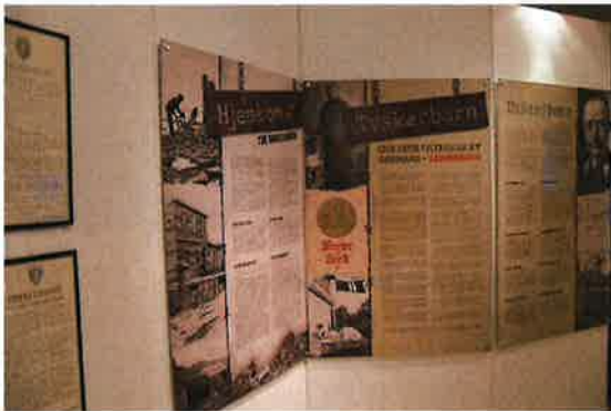
GOVVA SKUVVANVÁRE ČÁJÁHUSAS

Lassin ođđa báikki ja čájáhusarena ásaheapmái Levdnjii, lea Skuvvanvárrái ovdánahtton ođđa čájáhus ovttas Skuvvanváre giliseriin ja Porsáŋgu historjáserviin.