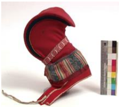
1@Bååstede: Hornlue som vil bli tilbakeført fra Norsk Folkemuseum

Samisk Museumsnettverk sitt prosjekt, "Primus på Samisk", som SVD/DSS har hatt faglig ansvar for, er ferdigstilt. Prosjektet er gjennomført i samarbeid med språkkonsulent Tor Magne Berg. Det er det utarbeidet en ordliste på 234 sider som omhandler samisk gjenstandsterminologi. Prosjektet er finansiert av Sametinget, Norsk Kulturråd og RDM.