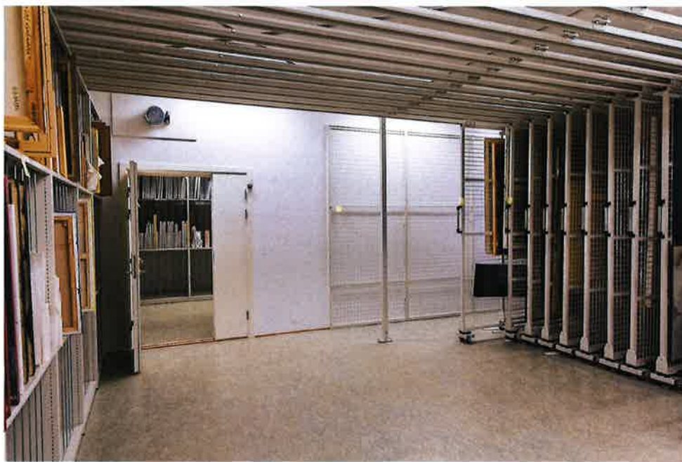
Det nye kunstmagasinet på Sápmiko

Kunstmagasinet ble høsten 2016 innredet med hylle- og skuffesystemer for oppbevaring av kunst. Det meste av Sametingets kunst og kunst i deponi ble flyttet og plassert i magasinene. SDM har deltatt på fellesmøte om Primus i Kautokeino. I 2016 registrerte SDM ca. 500 kunstverk. Samisk kunstmagasin registrerte 1202 kunstverk og publiserte 98 i 2016.