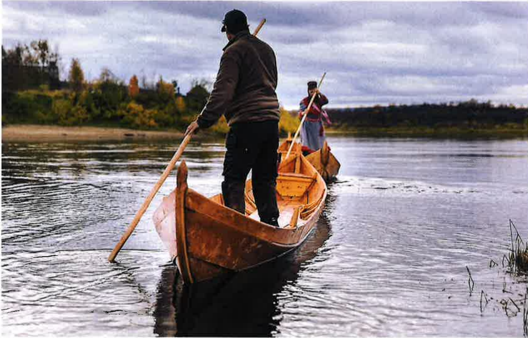
9. september 2016: elvesetting av båtene som ble lagd under båtbyggerkurset.

RDM – Jáhkovuona mearrasámi musea / Kokelv sjøsamiske museum