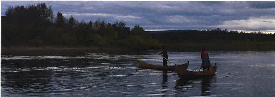
Fra elvesettingen 9. september 2016

SVD har 13 500 foto, 4690 gjenstander og 128 kunstverk i samlingen. Gjenstandene ved SVD-DSS finnes i utstillingene og i magasinene. Lys- og klimaforholdene i utstillingen er tilfredsstillende, men ikke optimale. Det er kun ved denne lokale enheten for RDM at det finnes et kjølemagasin. Njálja i utemuseet ble demontert, og en ny bærestolpe av rotfast furustamme ble klargjort. I 2016 ble det i forbindelse med en Frøysadal-utstilling scannet 435 bilder. 301 bilder og 157 fotokort ble scannet i forbindelse med Anna Næss-utstillingen. Tilveksten til samlingen i 2016 er 9 gaver og 29 innkjøp. I tillegg har det vært en tilvekst på 16 musikk-cd-er og 3 filmer. SVD registrerte 30 gjenstander og har ikke publisert noe i 2016. 80 Widerøe-bilder er klargjort til publisering på Digitalt Museum.