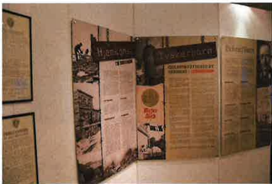
BILDE FRA UTSTILLINGEN I SKOGANVARRE

I tillegg til etableringen av ny lokalitet og utstillingsarena i Lakselv sentrum ble det utviklet en ny utstilling i Skoganvarre i samarbeid med Skoganvarre bygdelag og Porsanger historielag.